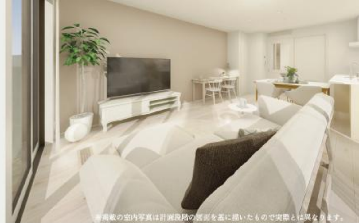
※掲載の室内写真は計画段階の図面を基に描いたもので実際とは異なります。